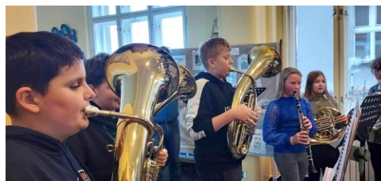
Adventní čas ve škole