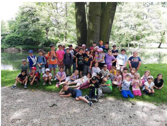
Výlet školní družiny