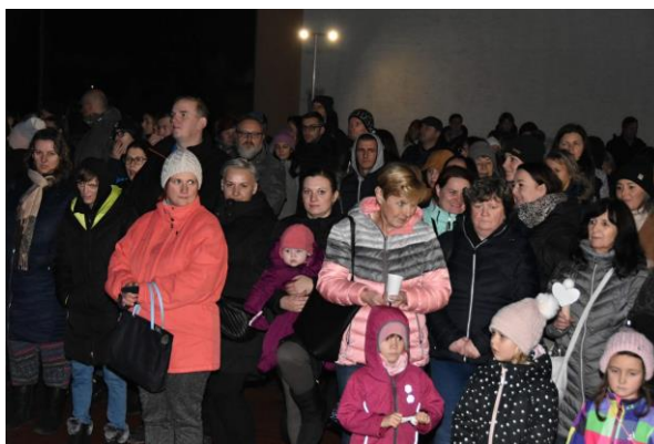
Zapojení naší školy do akce Česko zpívá koledy