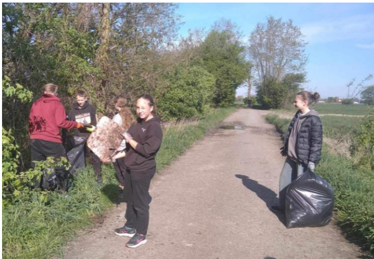
Den Země – zapojení do projektu „Uklidme Česko“