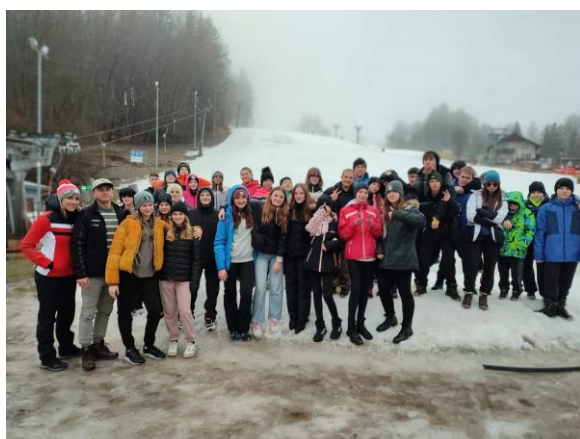
Lyžařský výcvikový kurz