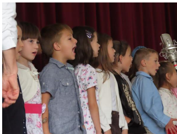
Akademie k 90. výročí otevření školy