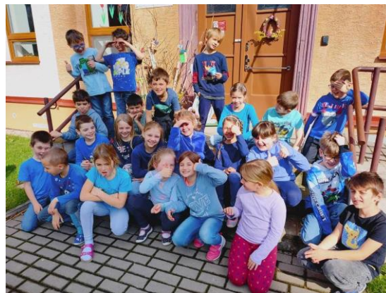
Barevný den – modrý den