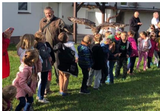
Ukázka výcviku dravců