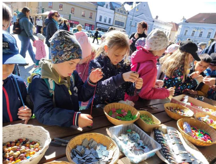
Den Země ve Vysokém Mýtě