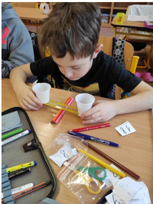
Pokusy a bádání