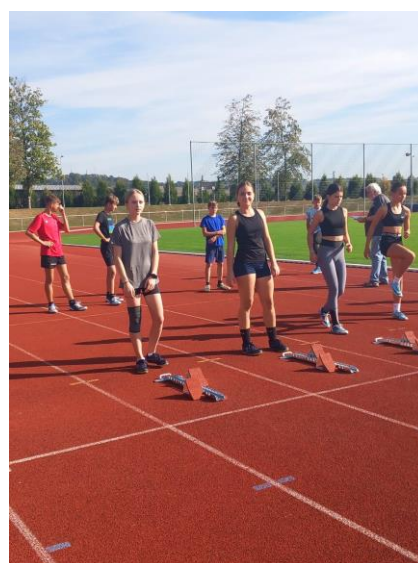
Memoriál B. Michalce