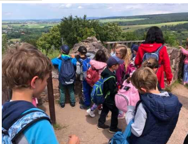
Výlet I. tříd a IV. třídy do Doudleb a na Potštejn