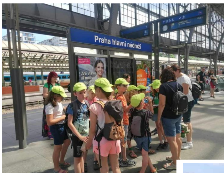
Výlet III. A do Prahy