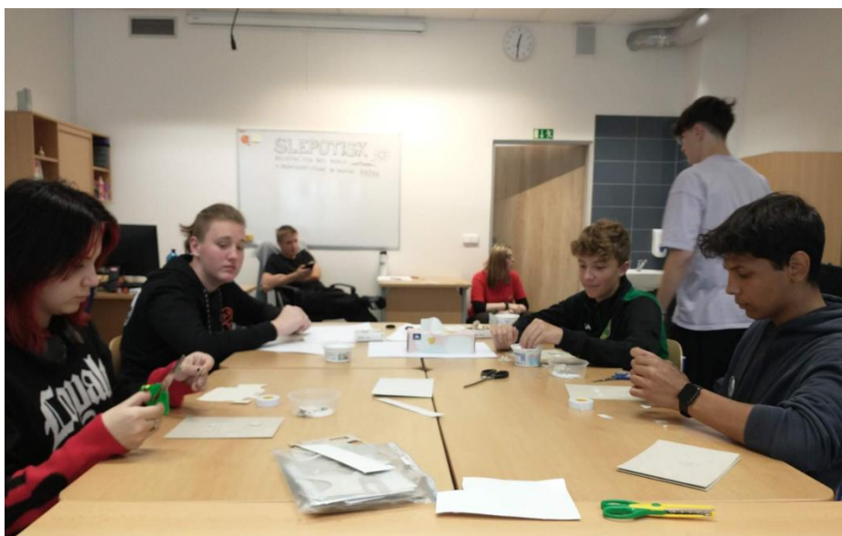
IX. třída – Technohrátky