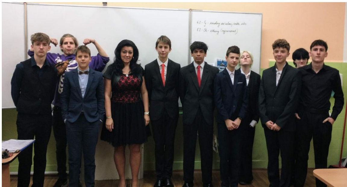
IX. třída ve společenském

Nástěnka výchovného poradce se nachází v prvním patře školy vedle místnosti výchovného poradce a je veřejně přístupná. Nabízí žákům užitečné informace týkající se volby povolání, osobnostního rozvoje a prevence rizikového chování. Žáci zde najdou přehled středních škol, termíny dnů otevřených dveří, praktické rady a kontakty na odbornou pomoc. Nástěnka je pravidelně aktualizována, aby žákům poskytovala aktuální a praktické rady pro jejich vzdělávací a osobní rozvoj. Nedílnou součástí nástěnky je také schránka důvěry, do které mohou žáci vhadzovat lístečky se sděleními, co je trápí nebo těší a co nechtějí řešit veřejně. V tomto roce nebyla do schránky vložena žádná stížnost. Což je pro nás velmi příjemné.