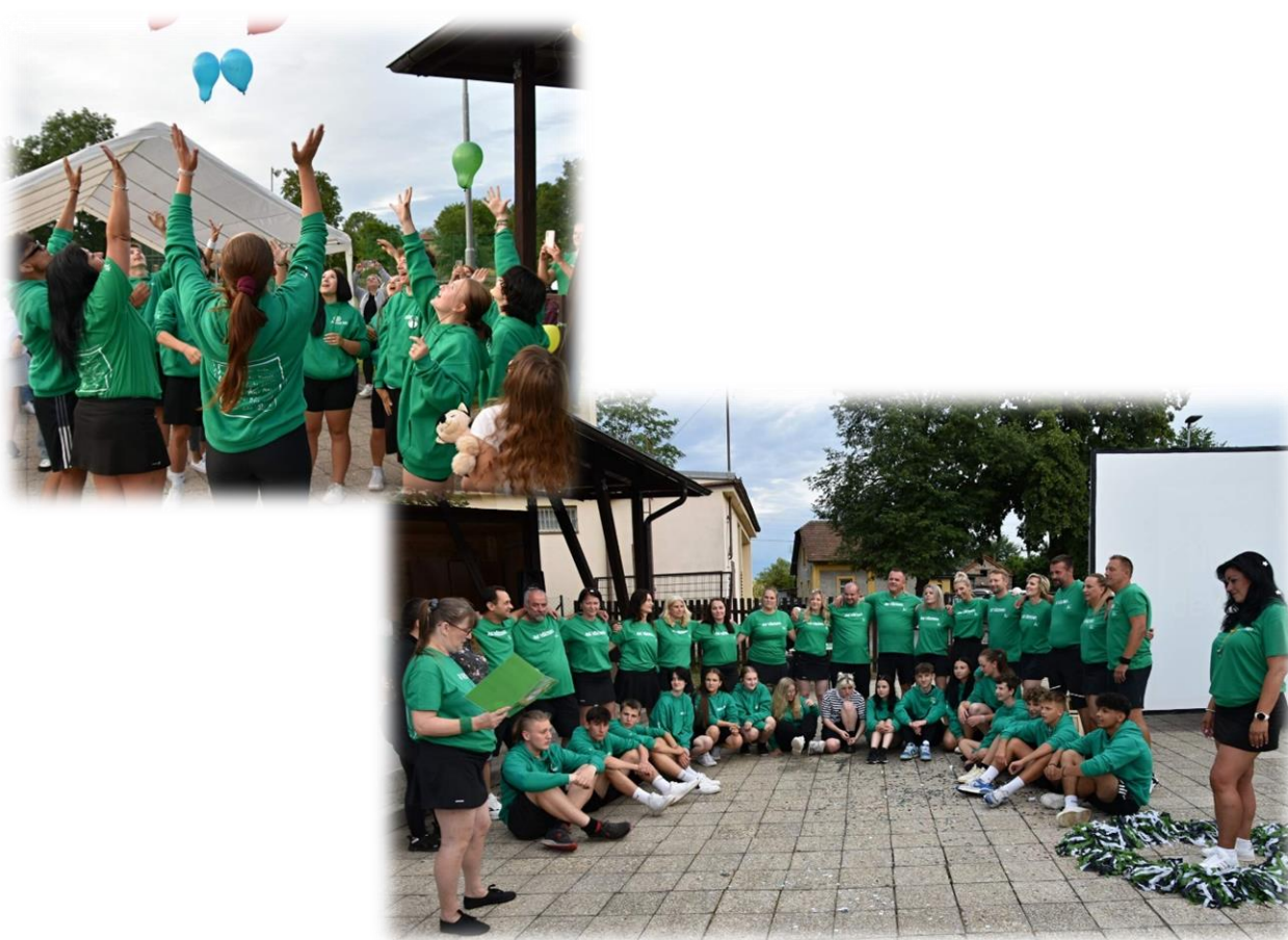
Společná akce školy a SRPD - Večírek devátáků