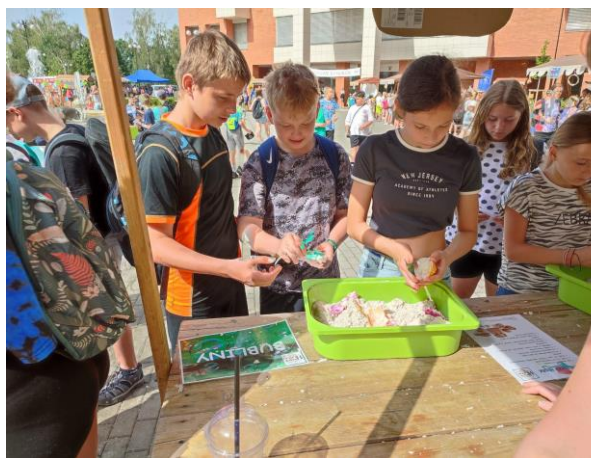
Hrajme si i hlavou

ŠVP Tereзка je k dispozici na webových stránkách školy a v kanceláři ředitelky školy.